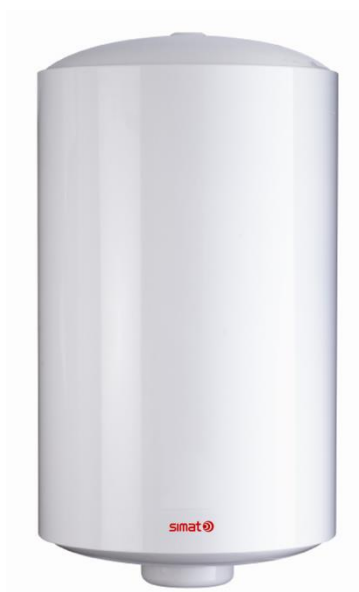
Modelos murales 150